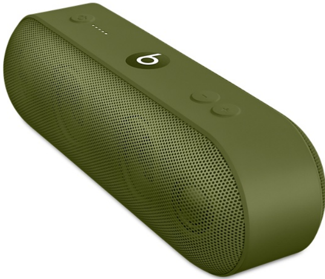
Caixa de som Beats Pill+ – Neighbourhood Collection.