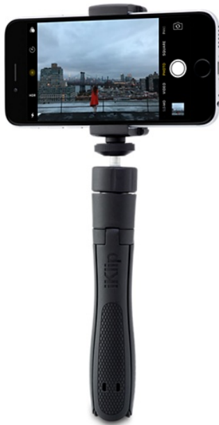
Pau de selfie e suporte iKlip Grip da IK Multimedia.