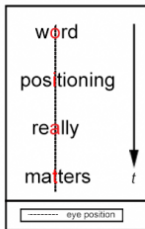
Figure 2. Spritz alignment of words

Aos poucos, você aumenta a velocidade e quando menos espera, está lendo mais de 1000 palavras por minuto.