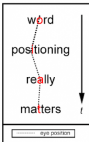
Figure 1. RSVP alignment of words

Esse método de speed reading parte do princípio de que seus olhos focam em um ponto central da palavra para poder compreendê-la. Por isso, além de colocar uma atrás da outra, o aplicativo alinha as palavras, para que esse centro fique sempre na mesma posição.